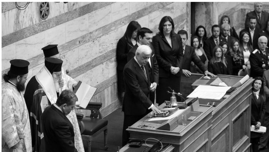
Ο Προκόπης Παυλόπουλος