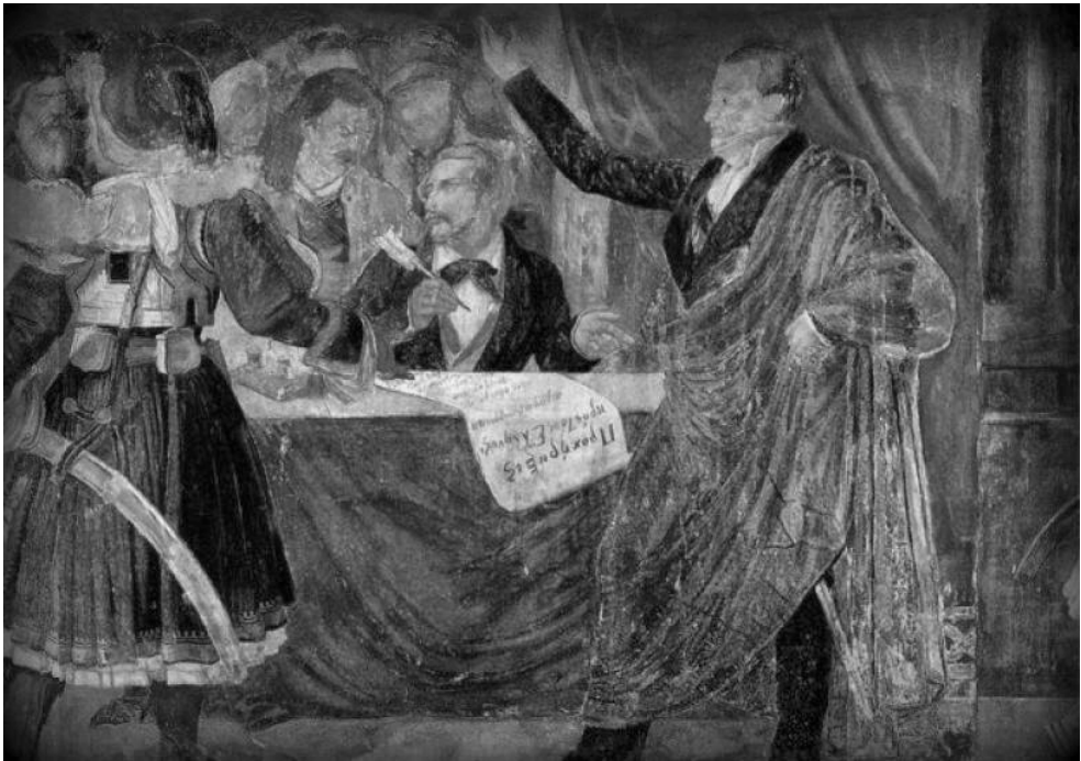
Το Σύνταγμα της Τροιζήνας

Το πληρέστερο όλων των Συνταγμάτων της Επανάστατικής περιόδου ψηφίστηκε στην Τροιζήνα τον Μάιο του 1827 από την Γ' Εθνοσυνέλευση, η οποία αποφάσισε πως «η νομοτελεστική εξουσία» πρέπει να παραδοθεί «εις ένα και μόνο», εκλέγοντας ως «Κυβερνήτη της Ελλάδος» με επταετή θητεία τον Ιωάννη Καποδίστρια.