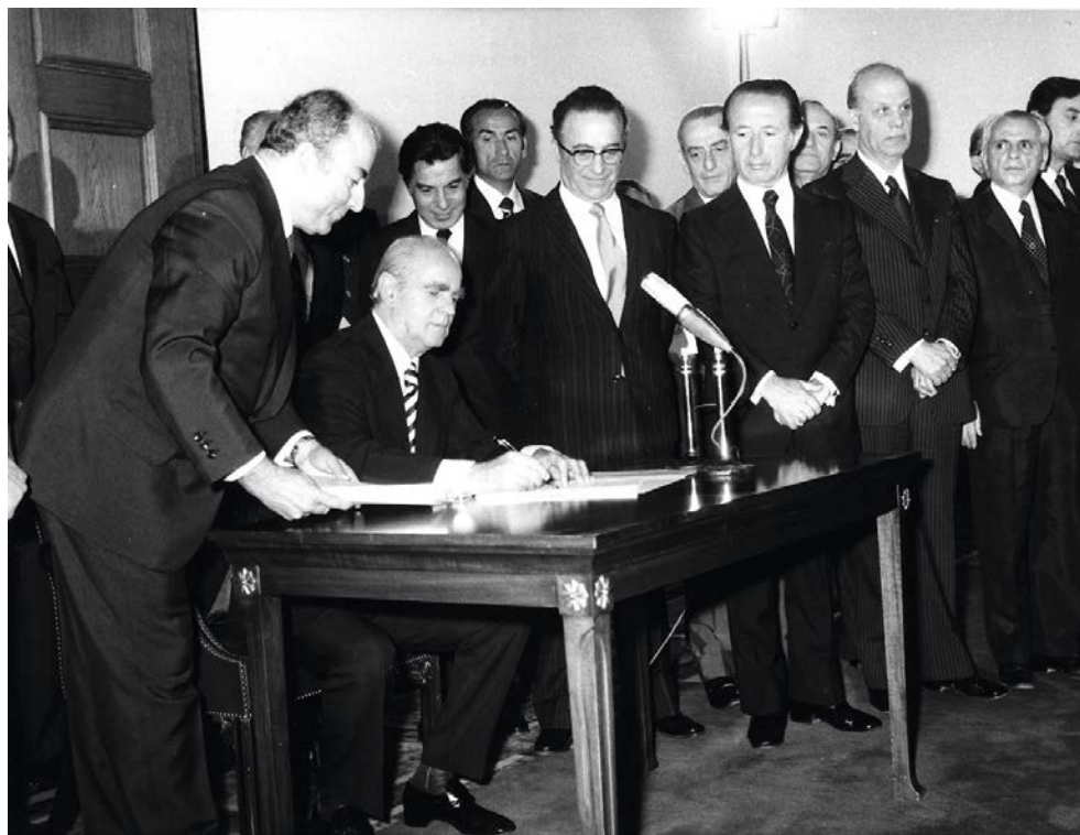
Η υπογραφή του Συντάγματος του 1975 από τον Κωνσταντίνο Καραμανλή