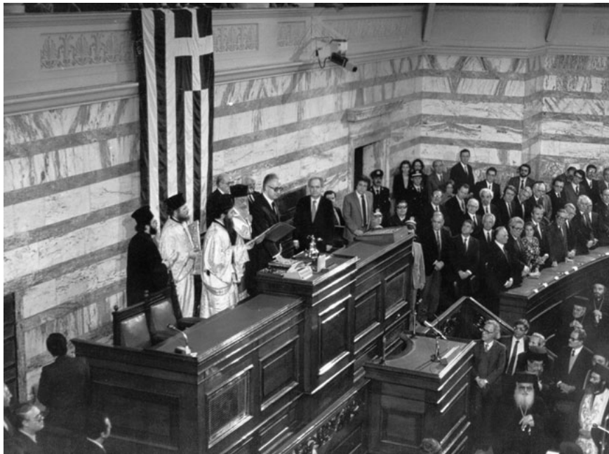
Ο Χρήστος Σαρτζετάκης