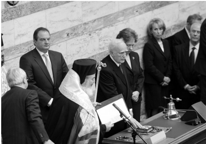
Ο Κάρολος Παπούλιας-πρώτη θητεία