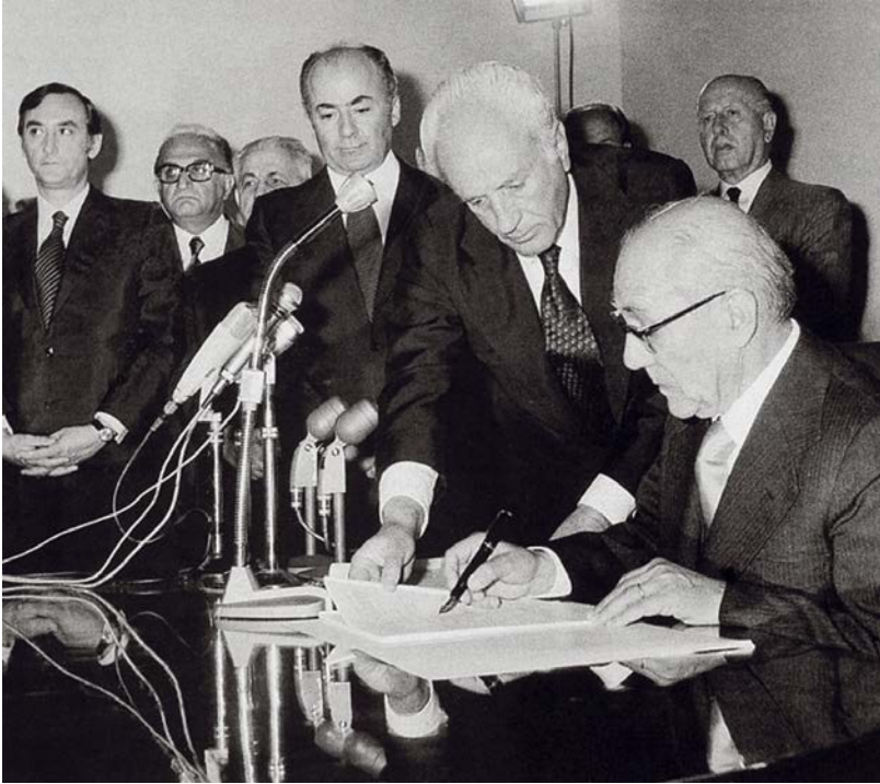
Ο προσωρινός Πρόεδρος της Δημοκρατίας Μιχαήλ Στασινόπουλος, υπογράφει το ψηφισμένο από τη Βουλή των Ελλήνων Σύνταγμα, 9/6/1975

Στο σημείο αυτό, για ιστορικούς λόγους, θα ήθελα να αναφέρω ονομαστικά τα 37 τακτικά και 19 αναπληρωματικά μέλη που απάρτιζαν την Συντακτική Επιτροπή.