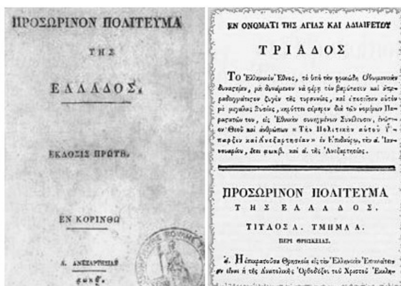
Το Σύνταγμα της Επιδαύρου

Η πρώτη κορυφαία στιγμή της πολιτικής ιστορίας της νεότερης Ελλάδας σε επίπεδο εθνικής πολιτειακής ρύθμισης, η οποία εδραίωσε το συνταγματισμό στη συνείδηση της ελληνικής κοινωνίας ως το θεμελιώδες και αναγκαίο κριτήριο πολιτικής νομιμότητας, ήταν η ψήφιση του πρώτου ελληνικού συντάγματος εθνικής εμβέλειας από την Α' Εθνοσυνέλευση της Επιδαύρου, τον Ιανουάριο του 1822.