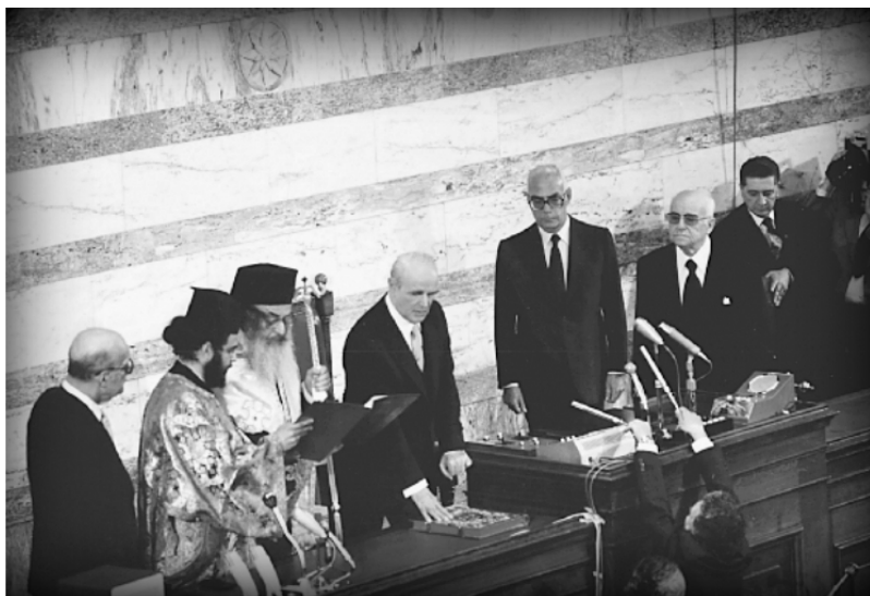
Ο Κωνσταντίνος Καραμανλής-πρώτη θητεία