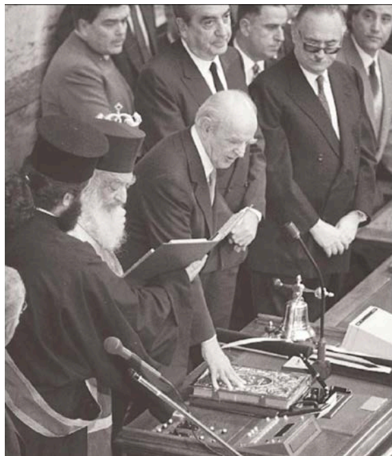
Ο Κωνσταντίνος Καραμανλής-δεύτερη θητεία