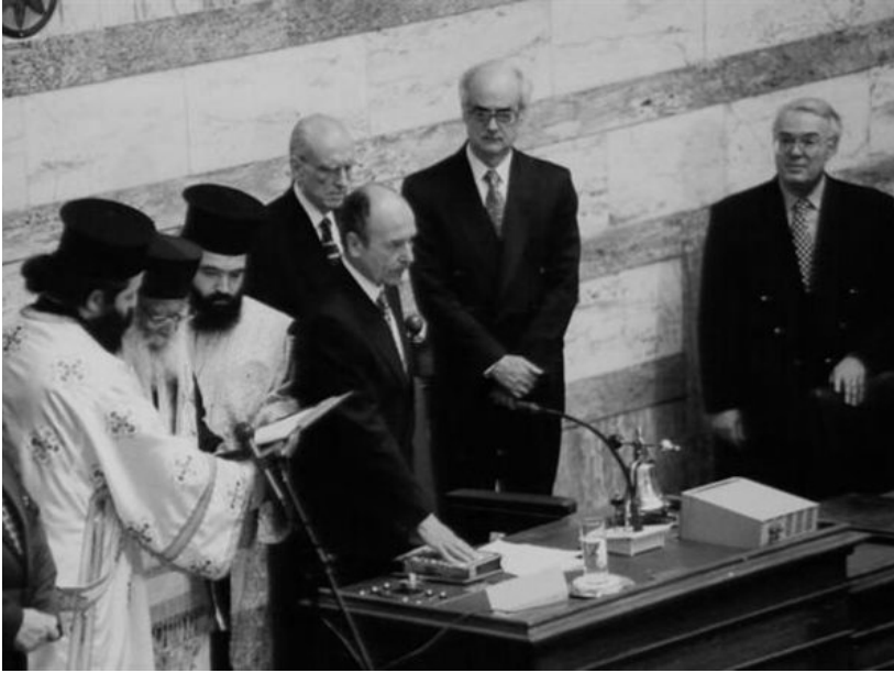
Ο Κωστής Στεφανόπουλος-πρώτη θητεία