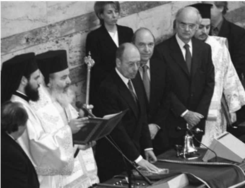
Ο Κωστής Στεφανόπουλος-δεύτερη θητεία