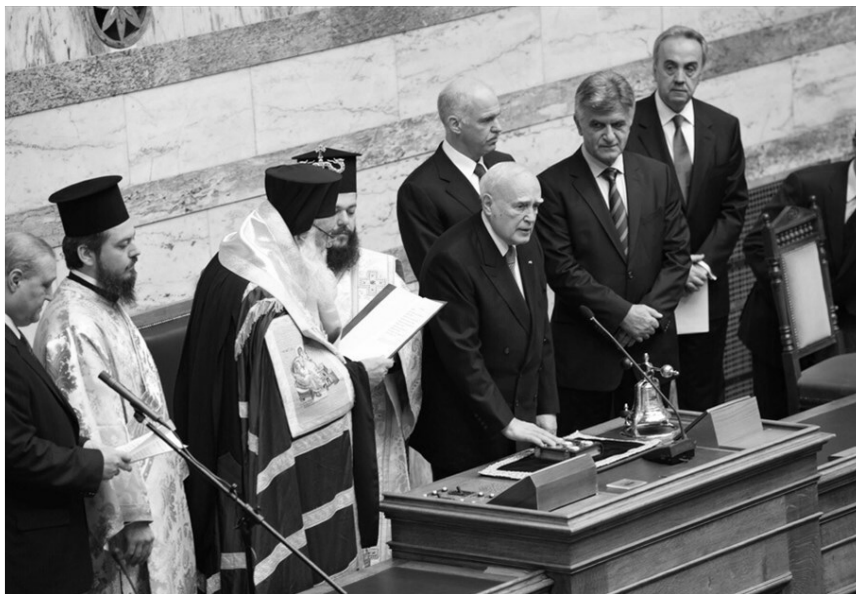
Ο Κάρολος Παπούλιας-δεύτερη θητεία